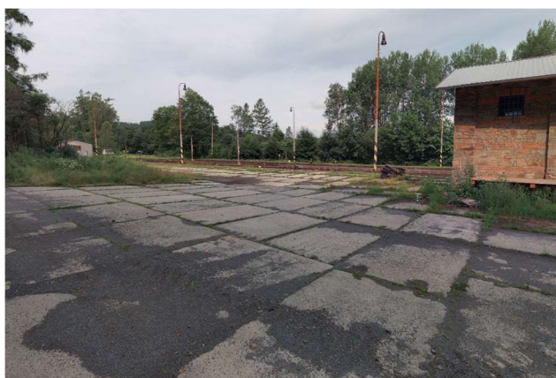
Obr.: plocha pro zařízení staveniště

s bezproblémovým příjezdem po místní komunikaci ve vlastnictví Moravskoslezského kraje. Plocha bude využita jako zázemí pracovníků i skládková plocha použitého materiálu.